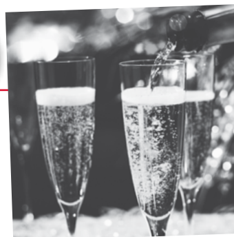
2015 bescherte ConSol vier 10-Jahres- und fünf 15-Jahres-Dienstjubiläen.