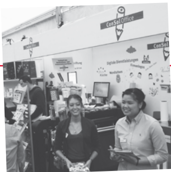
Im Herbst waren wir mit den «Digitalen Dienstleistungen» an der Zuger Messe.