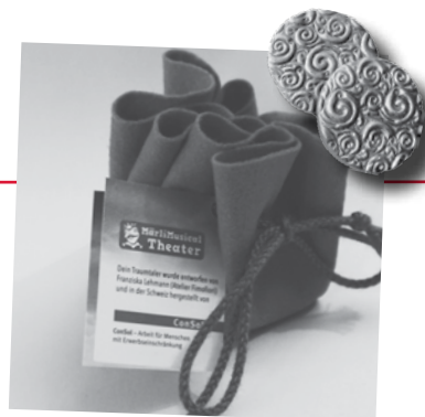
Ein Grossauftrag des Märli-MusicalTheaters beschäftigte Textil & Office das ganze Jahr.